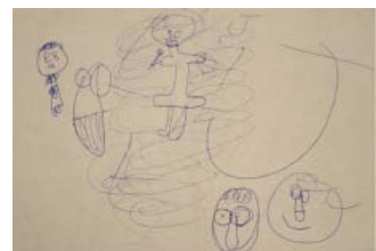
F.4 - Dibujo "Niño-sin-cabellos" 1