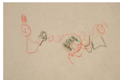
F.2 - Dibujo "Pito-periquita" 2