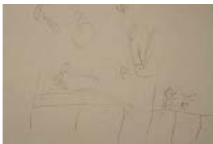
F.1 - Dibujo "Pito-periquita" 1