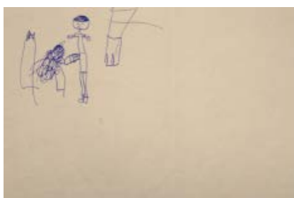
F.5 - Dibujo "Niño sin cabellos" 2