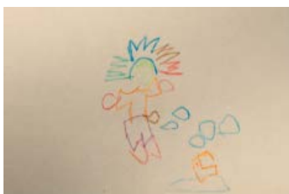
F.7 - Dibujo "Indio-tocado-flauta"