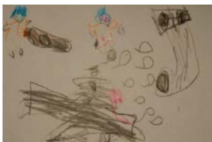
F.3 - Dibujo "Pito-periquita" 3